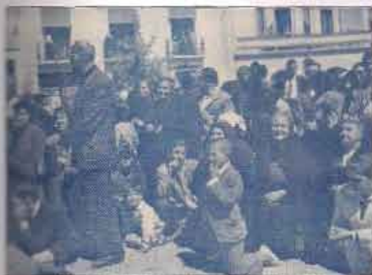
Devotos al paso de la procesión. Años 50

En la Villa de Hellín a diez días del mes de noviembre de mil y quinientos y sesenta y seis años, estando en la Visitación de la dicha Villa le fue presentada una licencia para edificar una Capilla en la Iglesia de esta Villa, en la parte de la Epístola, la primera conforme al traslado de la Iglesia antigua,