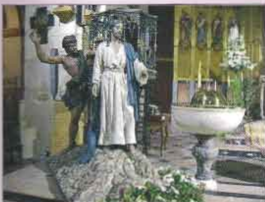
Detalle de El Prendimiento en la Parroquia