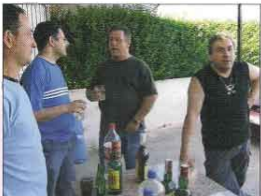
Momento de intercambio de opiniones