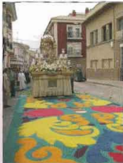
Carroza del Corpus sobre la alfombra de El Prendimiento