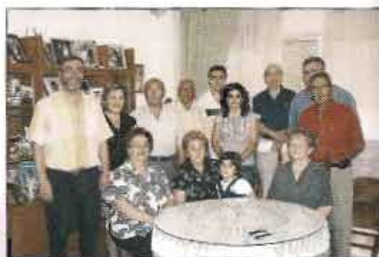
Todos los presentes durante el acto protocolario

Desde la Cofradía de El Prendimiento, se les da las gracias por ese gesto tan hermoso y entrañable de donar la casa, en la cual se guardarán todos los enseres, se celebrarán las reuniones y se gestionará todo. Gracias.