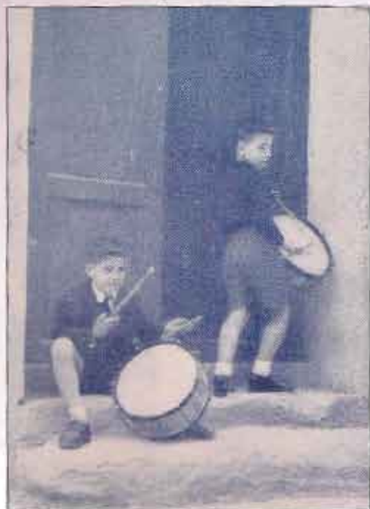
Niños con tambores. Años 50