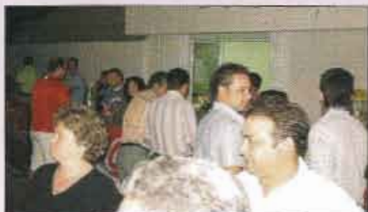
Barra de las fiestas de Agramón

Una de las principales fuentes de financiación, es el montaje de chiringuitos para la venta de bebidas en las fiestas de algunos pueblos, como ha sido el caso concreto en el verano de 2007, de las pedanías de Isso en primer lugar y Agramón posteriormente.