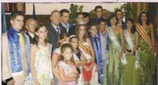
El Alcalde y el Presidente de la Cofradía con los Hellineros salientes

Continuando con la tarea emprendida en 2006, la Cofradía de El Prendimiento volvió a plantearse la organización de los actos de elección de Hellineros infantiles y adultos de la Feria 2007, con el fin de obtener ingresos.