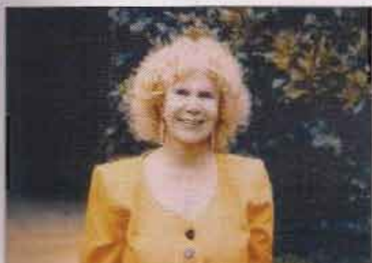
La Duquesa de Alba en una foto dedicada a la Cofradía

Cuando se dice que se buscan desde la Cofradía otras fuentes de financiación, son varias las alternativas que se barajan, lo que sucede es que unas se consiguen y otras no.