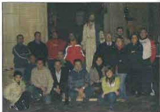
Cofrades junto a Jesús de El Prendimiento