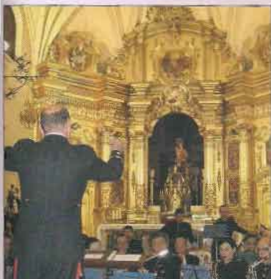
El Comandante Grau dirigiendo a la Música del Tercio de Levante

El historial de esta Banda está repleto de importantes hechos, entre los que podemos destacar la participación en el rodaje de la