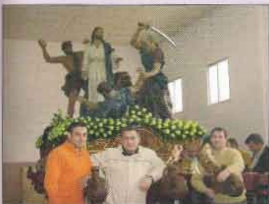
Costaleros Jueves Santo con El Prendimiento tras prepararlo todo para la Procesión