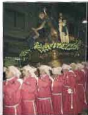
Procesión del Silencio