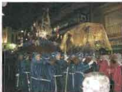
El Cristo del Gran Poder y El Prendimiento cruzándose Jueves Santo por la Calle El Sol