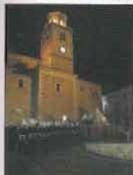
Jueves Santo con la banda llegando a la Asunción