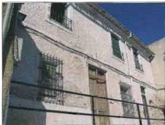
Fachada de las casas donadas a la Cofradía

Así se hizo, hablaron con Pepe que es otro de los fotografiados en esa mañana, quien comentó que está situada en la calle el Beso y que al día siguiente podían subir a verla.