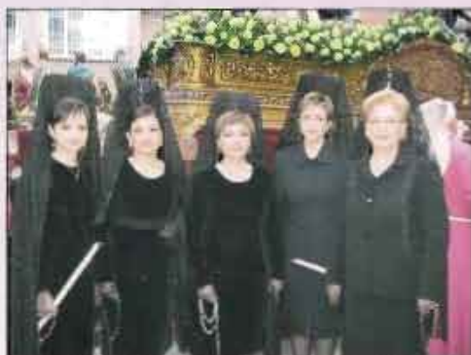
Algunas Manolas que desfilaron por primera vez con El Prendimiento Jueves Santo

Puestos todos en sus sitios, sonó la campana por segunda vez y El Prendimiento se levantó para salir del patio y dirigirse a la puerta principal del Convento de los Capuchinos, situado en la Gran Vía.