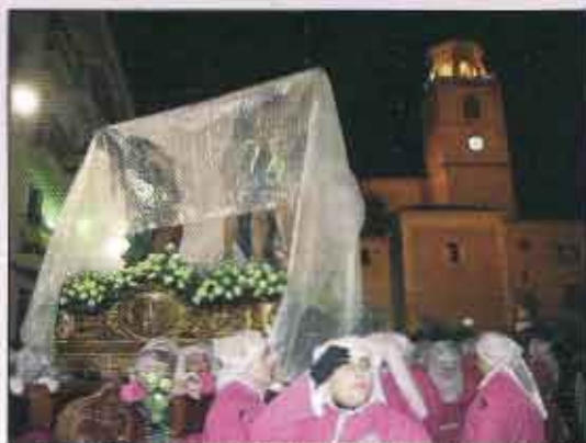
Subida a la Parroquia con las imágenes tapadas por la lluvia