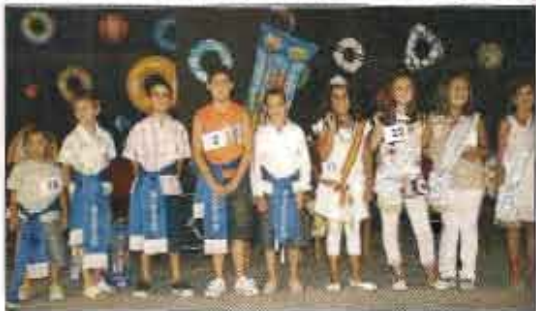
Hellineros/as elegidos en 2007

Finalizada la votación, y antes de proclamar a las personas elegidas, se hizo un sorteo de 4 Dvd's y 2 cámaras fotográficas digitales.