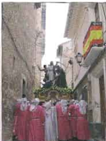
Viernes Santo bajada por la calle Santa Clara