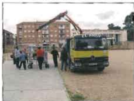
En Moje descargando en Capuchinos