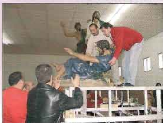
Miembros de la Cofradía montando las imágenes

procesionales los hombres de trono van alrededor y lo ocultan.