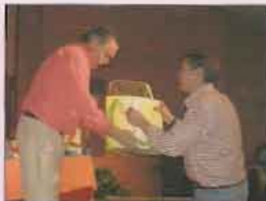
Sorteo de regalos durante la cena