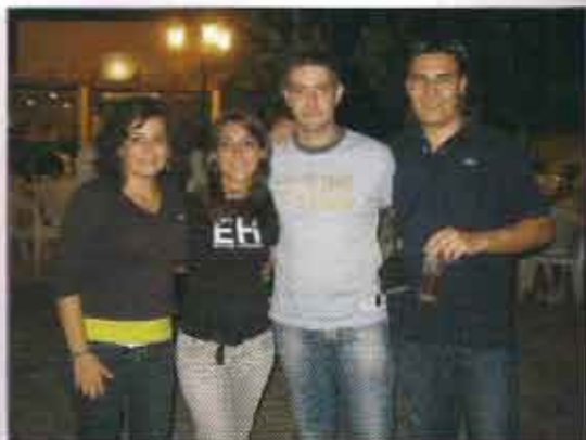
Miembros del Ecce Homo y Prendimiento durante las fiestas de Agramón