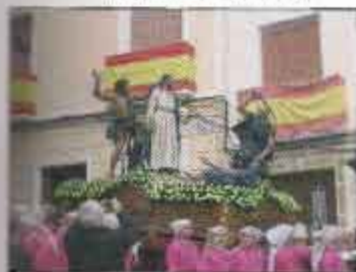
Salida Viernes Santo por la mañana