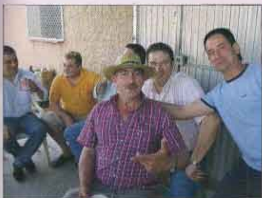
Diversión de los Costaleros durante la comida

Desde 1999 en que volvió a salir El Prendimiento con costaleros, se viene celebrando una comida en Villa Dados, con los portadores de la imagen.