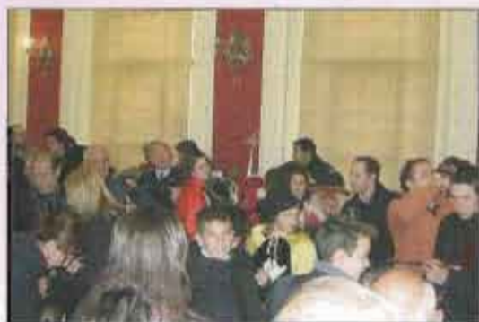
Ambiente en el Salón de Plenos del Ayto. para recibir la declaración de Internacionalidad

Dada la importancia y la significación que marcó dentro de la historia de la Semana Santa hellinera, su declaración como de Interés Turístico Internacional (Tamborada), no podemos dejar de dedicar un apartado a ese hito.