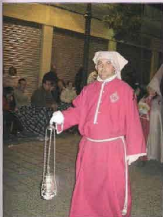
Un costalero con el incensario estrenado en la noche de Jueves Santo

Todo fue perfectamente, y al llegar al arco del Salvador sonaron de nuevo los acordes del Himno para despedir al Prendimiento en la