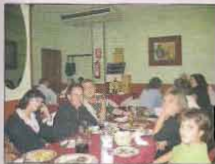
Cena de directivos en la Feria