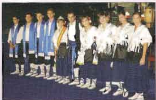
Hellineros/as de la Feria 2007

Todo el traslado de los hellineros de 2006 que se despedían esa noche, fue gentilmente