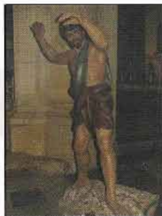
Judas y el judío una vez desmontados para ser restaurados