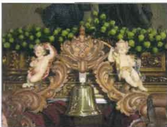
Detalle del arco de campana estrenado el Jueves Santo de 2007

Al momento, entró espectacular la Banda de Cornetas y Tambores "La Samarita" de Alguazas, en busca de la imagen, emocionando con sus toques sevillanos a cuantos allí se aglomeraban.