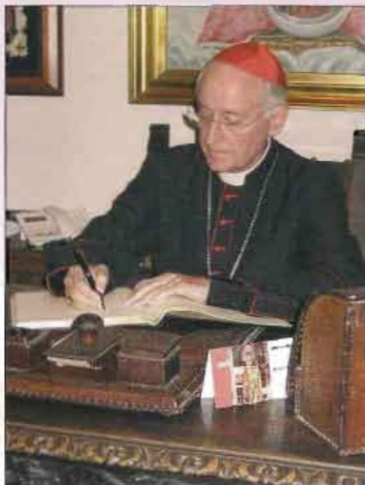
El Cardenal Ricard Maria Carles, firmando en el libro de honor de la Cofradía

Para la Eucaristía del 14 de marzo de 2007, se buscó un Cardenal que la oficiara, labor algo complicada dadas las ocupaciones de todos ellos así como el escaso número de estos en España, cinco existentes en ese momento (tres en activo y dos jubilados).