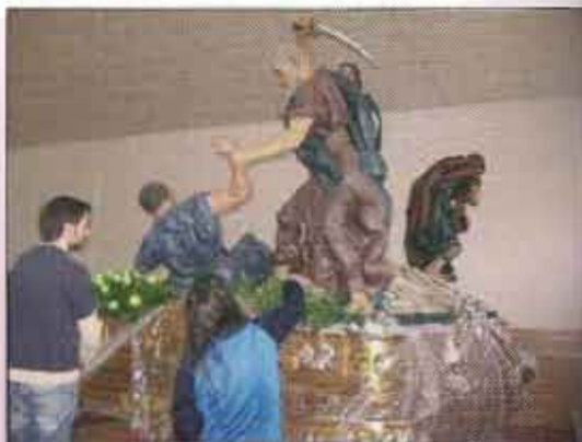
Quico realizando el arreglo floral

Ese día será otra fecha histórica dentro de este colectivo de Semana Santa, pues como se narra en otro capítulo de esta revista, fue cuando comenzaron las gestiones de la futura