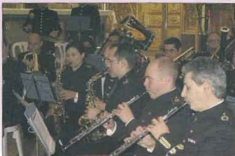
Los músicos militares durante el concierto