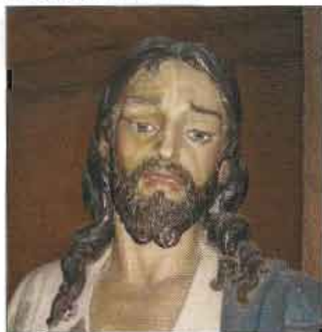
A la derecha aspecto de la cara repintada y a la izquierda policromía primitiva

Comenzadas las primeras pruebas, Pablo vio que podría lograr su objetivo y devolverlo todo a su estado primitivo, tal y como salió de las manos de Coullaut-Valera.