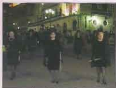
Manolas Jueves Santo