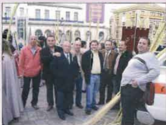
Directivos y colaboradores repartiendo las palmas Domingo de Ramos