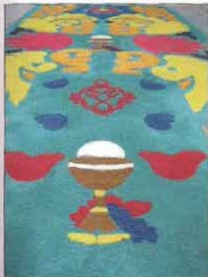
Alfombra realizada por la Cofradía de El Prendimiento para el Corpus de 2007