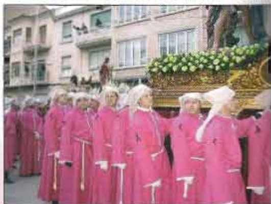
Costaleras luciendo lazas negras

Mención especial merecen los portadores pues su comportamiento fue el de unos valientes, subiendo con ritmo fuerte a la Asunción, haciendo