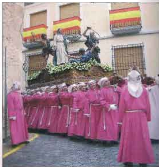
Salida de Viernes Santo por la calle Santa Clara